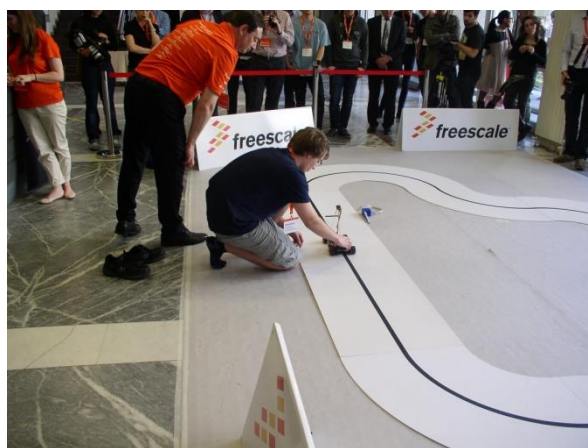
Startuje tým Roznovaci

Náš tým Valasi se umístil na třetím místě. Ale oceněná byla odvaha nutná k účasti.