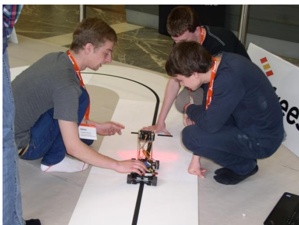
Trénuje tým Valasi

Před vlastní ostrým startem samozřejmě všichni trénovali.