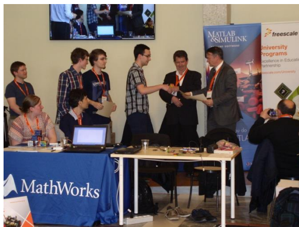
Diplomy a kity přijímá tým Roznovaci