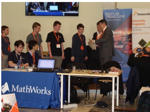
Diplomy, kity a plaketu přijímá tým Valasi

Náš tým Valasi se umístil na třetím místě. Ale oceněná byla odvaha nutná k účasti.